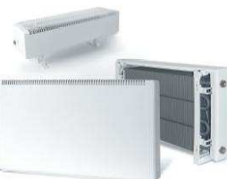
Классические медно-алюминиевые конвекторы ИзоТерм М