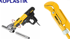
Сантехнический инструмент REMS, BRINKO