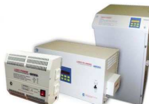
Электронные стабилизаторы напряжения PROGRESS, LIDER