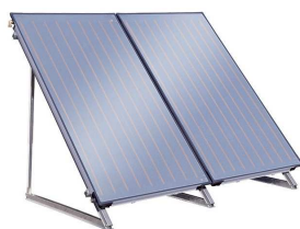
Солнечные водонагреватели (коллекторы) BOSCH, SAPUN, BUDERUS