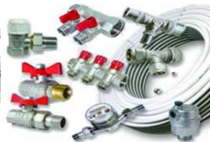
Металлопластиковые системы и запорно-регулирующая арматура VALTEC, VALSIR MIXAL