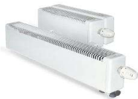
Стальные конвекторы NOVOTERM НовоТерм Медно-алюминиевые конвекторы с терморегуляторами ИЗОТЕРМ isotherm, EcoTerm ЭкоТерм, CORALL Коралл