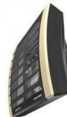
Тепловые электро-водяные воздушные завесы DEFENDER, ТЕПЛОМАШ и воздушонагреватели VOLCANO