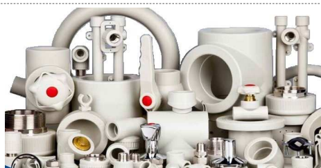
Полипропиленовые трубопроводы Wavin ЕКОPLASTIK