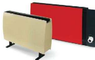
Медно-алюминиевые дизайн-конвекторы ATOLL, ATOLL Pro, RODOS