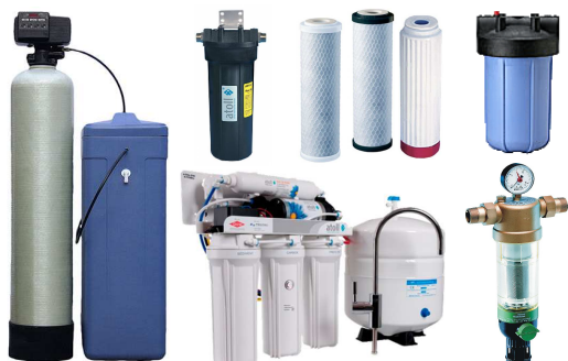
Фильтры, Картриджи, Водоподготовка, УФ-обеззараживатели, Баллоны, Управляющие клапаны, Реагенты, Засыпки