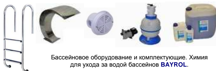
Бассейновое оборудование и комплектующие. Химия для ухода за водой бассейнов BAYROL .

АКВАМАСТЕР гк г.Краснодар www.aquamaster.net.ru info@aquamaster.net.ru КОТЛЫ. РАДИАТОРЫ. КОНВЕКТОРЫ. ТРУБЫ. НАСОСЫ. АРМАТУРА. КИПиА. СТАБИЛИЗАТОРЫ. БОЙЛЕРЫ. ГОРЕЛКИ. ФИЛЬТРЫ. ВОДОПОДГОТОВКА. БиоСЕПТИКИ. БАССЕЙНЫ. ИЗОЛЯЦИЯ. ВЕНТИЛЯЦИЯ. САНТЕХНИКА. Розница: +7 (861) 279-04-00, моб. megafon +7 928 660-01-86, ОПТ: +7 (861) 279-10-01, моб. mts +7 988 602-60-48