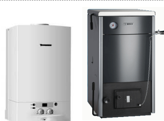
Настенные и напольные котлы, бойлеры, горелки BOSCH, DRAZICE, ACV, BUDERUS, LAMBORGHINI, PROTHERM