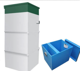
БиоСептики ЕвроБион Жируловители EvoStok