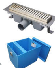
Инсталляции AlcaPlast, Viega , Санфаянс ROCA, JIKA . Ванны, душевые двери и поддоны, смесители RAVAK, GROHE