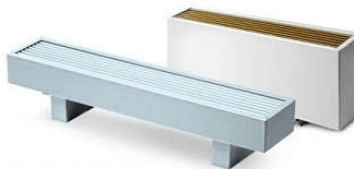
Медно-алюминиевые дизайн-конвекторы CORALL Коралл