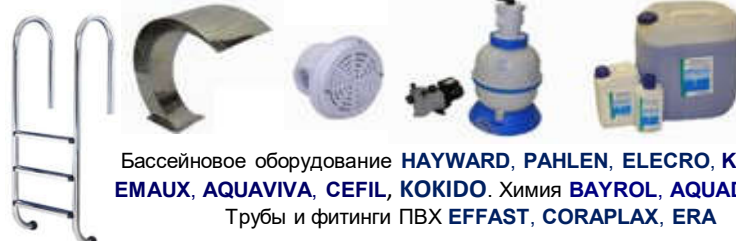
Бассейновое оборудование HAYWARD, PAHLEN, ELECRO, KRIPSOL, EMAUX, AQUAVIVA, CEFIL, KOKIDO . Химия BAYROL, AQUADOCTOR . Трубы и фитинги ПВХ EFFAST, CORAPLAX, ERA

АКВАМАСТЕР гк г. Краснодар www.aquamaster.net.ru info@aquamaster.net.ru КОТЛЫ. РАДИАТОРЫ. КОНВЕКТОРЫ. ТРУБЫ. НАСОСЫ. АРМАТУРА. КИПИА. СТАБИЛИЗАТОРЫ. БОЙЛЕРЫ. ГОРЕЛКИ. ФИЛЬТРЫ. ВОДОПОДГОТОВКА. БиоСЕПТИКИ. БАСЕЙНЫ. ИЗОЛЯЦИЯ. ВЕНТИЛЯЦИЯ. САНТЕХНИКА. Telegram Viber WhatsApp: megafon +7 928 660-01-90, mts +7 988 602-60-48 +7 (861) 279-10-01