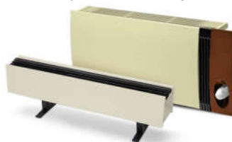
Медно-алюминиевые дизайн-конвекторы ATOLL и ATOLL Pro