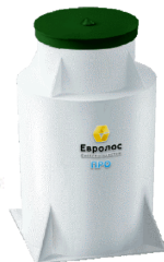
Автономная канализация EUROLOS , Жироуловители EvoStok , Канализация HL, OSTENDORF, AlcaPlast, Viega