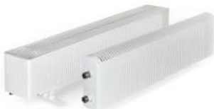
Стальные конвекторы НОВОТЕПМ novoterm