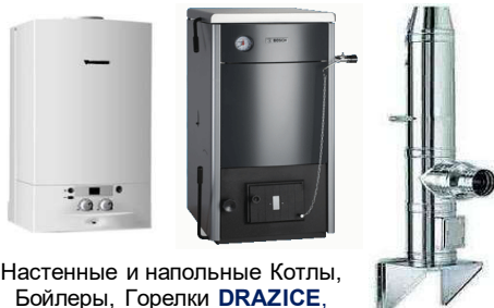
Настенные и напольные Котлы, Бойлеры, Горелки DRAZICE, ACV, BUDERUS, LAMBORGHINI, PROTHERM, VAILLANT, BAXI, NAVIEN