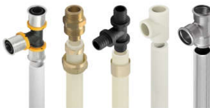
Полипропиленовые системы Wavin EKOPLASTIK экопластик Чехия, VALTEC валтек, Пластиковые и Металлопластиковые трубы VALSIR, VALTEC, REHAU, SANEXT